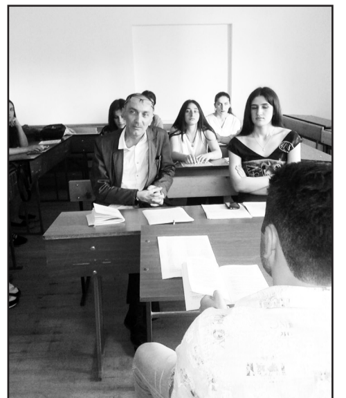
დასასრული გვ. 4