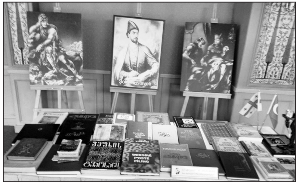
„ვეფხისტყაოსნის“ გამოცემით გამოფენა შოთა რუსთაველის სახელობის ქართული კულტურის ცენტრში