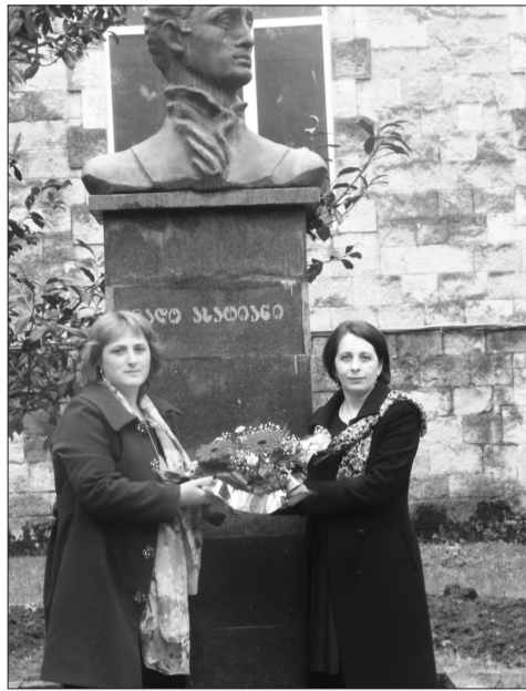
ბათუმელი სტუმრები გვირგვინით ამკობენ ლალოს ძეგლს

„ვისაც მფარველად გუხა ჰყოლია, უავღარიპო იყოს სახელი მისი“