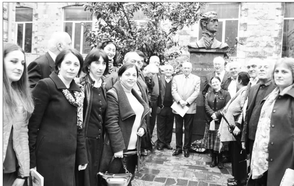
უნივერსიტეტის ლექტორ-მასწავლებელთა ერთი ჯგუფი ლალოს ძეგლთან.

ლალო ასათიანის სტუდენტობიდანვე სამწერლო ასპარეზზე ვხვდავთ. „ჩვეულებრივ მგოსანი სამოღვაწეო ასპარეზზე გამოდის ყოველწლიურად თითო-თითო ლექსით. 1936-1937 წლებში ქუთაისის საქალაქო გაზეთში ამ გაზეთის რედაქტორების პარმენ შეღვეიასა და გიორგი ჯიბლაძის მხრსხველობით ლალოს 24 ლექსი